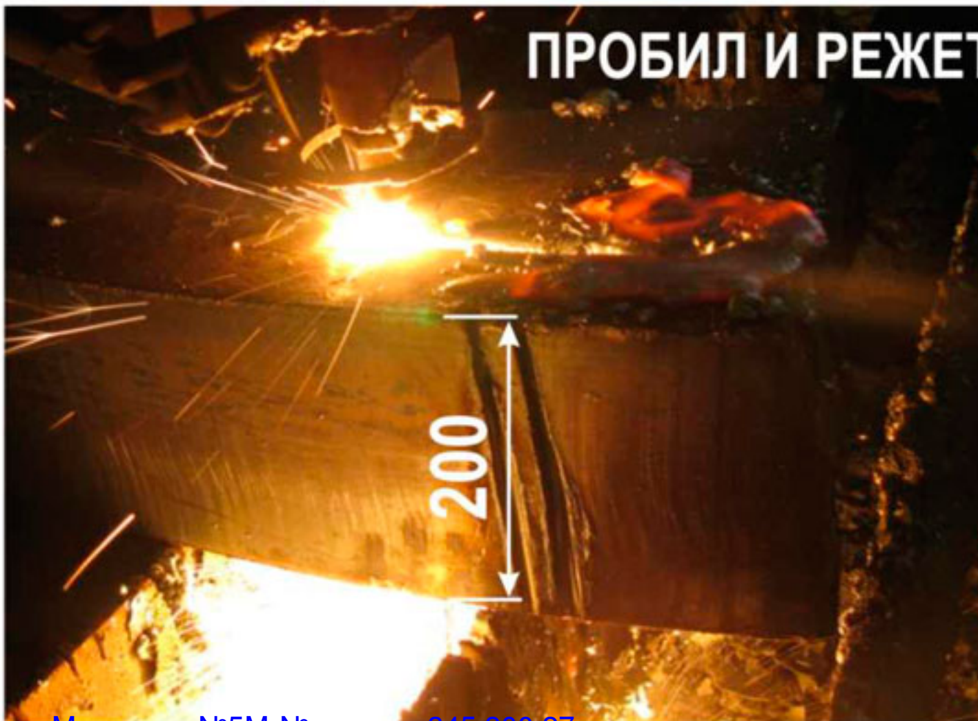
Мундштук №5М № заказа: 345.300.27