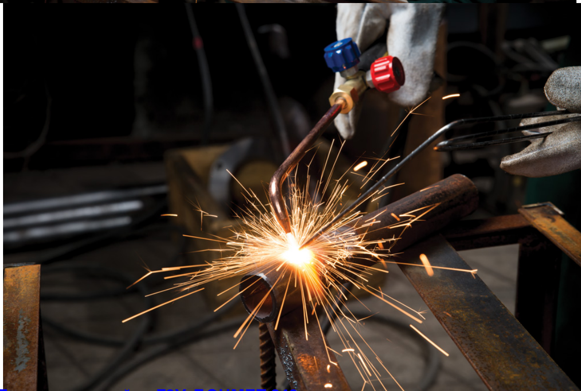
Горелка для пайки ГЗУ ДОНМЕТ 248